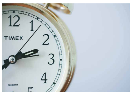
Workshop de coaching para associados

A Fundação Social Bancária tem vindo a desenvolver iniciativas na área da saúde, trabalho, formação profissional, família e cultura, e conta com o apoio de todos os associados do SNQTB para poder continuar a desenvolver este tipo de iniciativas. No preenchimento do seu IRS pode consignar 0,5% à FSB, um processo que não representa qualquer custo para si - uma vez que se trata de uma reafecção do dinheiro a uma instituição - mas que poderá ter um peso muito significativo para todos aos que integram a Fundação Social Bancária. Segundo o Ministério das Finanças, 558.153 contribuintes doaram cerca de 16,6 milhões de euros a instituições em 2016.